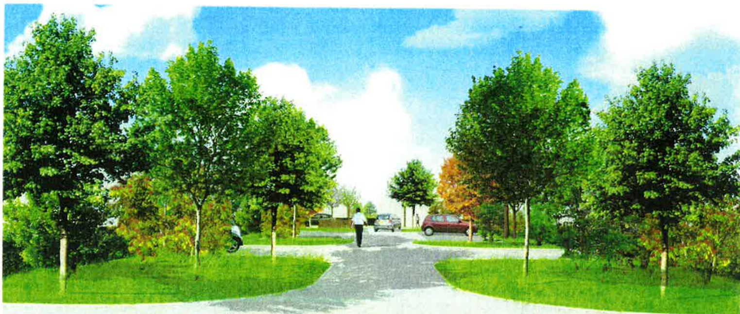
Ambiance végétale d'une cour

Le projet du lotissement dit les Prés a pour objectif d'intégrer l'ensemble des critères correspondant aux écoquartiers et à la Haute Qualité Environnementale dite H.Q.E. Cette conception a pris en compte, lors de l'élaboration du plan de masse, les relations avec son environnement bâti et végétal, la place privilégiée pour le piéton et les deux roues vers les équipements scolaires, la gare et les commerces du centre.