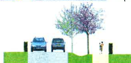
Profil en travers d'une cour