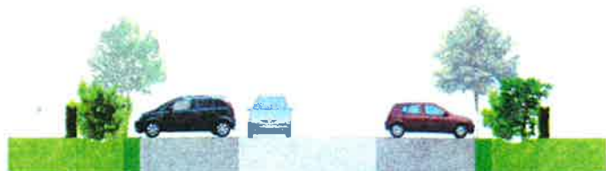
Profil en travers de la voirie