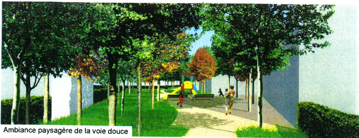
Ambiance paysagère de la voie douce

Le projet du lotissement dit les Prés a pour objectif d'intégrer l'ensemble des critères correspondant aux écoquartiers et à la Haute Qualité Environnementale dite H.Q.E. Cette conception a pris en compte, lors de l'élaboration du plan de masse, les relations avec son environnement bâti et végétal, la place privilégiée pour le piéton et les deux roues vers les équipements scolaires, la gare et les commerces du centre.